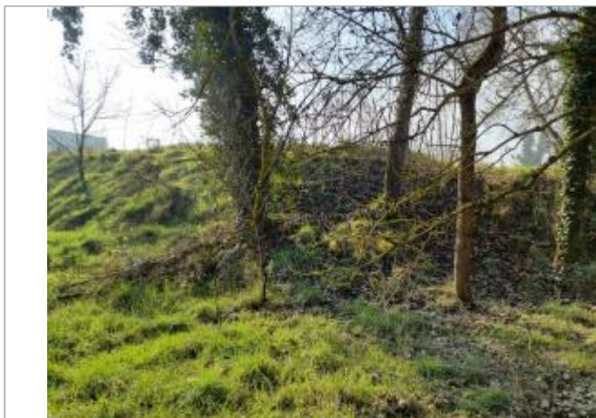
Trace sur Végétation