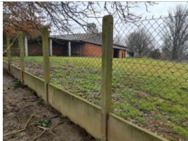
marque sur structure