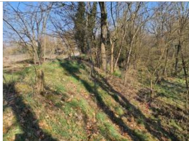
Trace sur Végétation