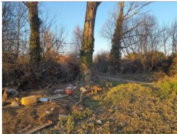
Trace sur Végétation