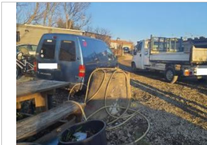
marque sur structure