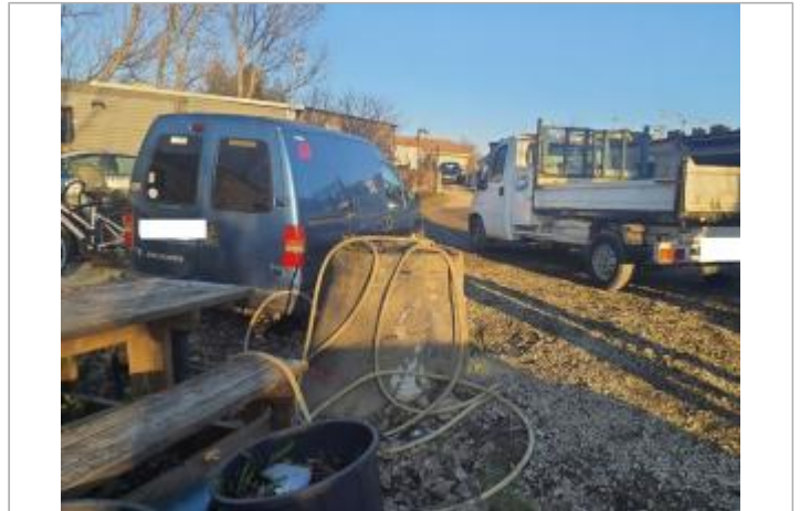
marque sur structure