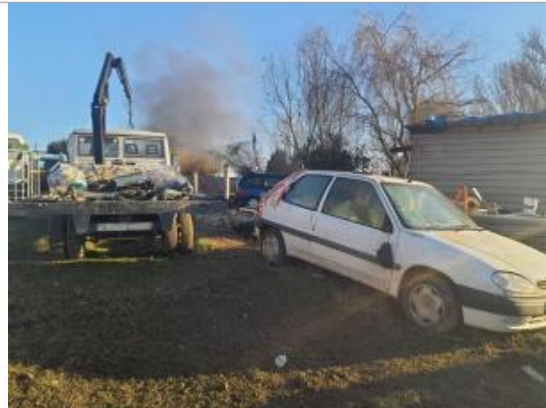
Marque sur véhicule