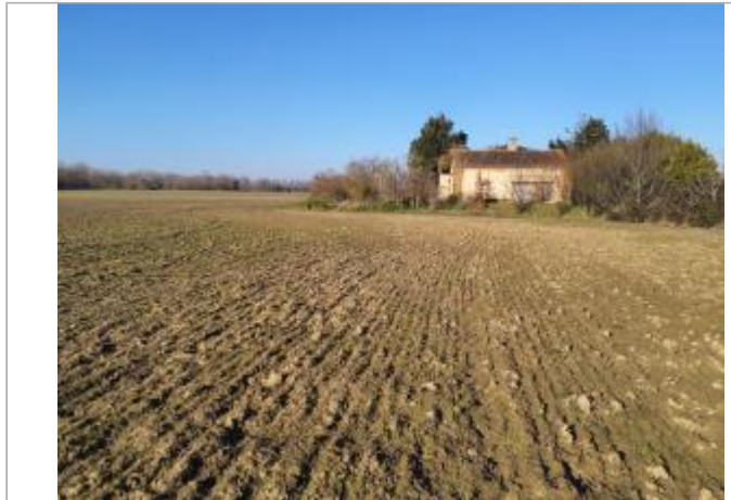
Débris végétaux

Coordonnées WGS84 : X: 1.40677840 / Y: 43.64168460