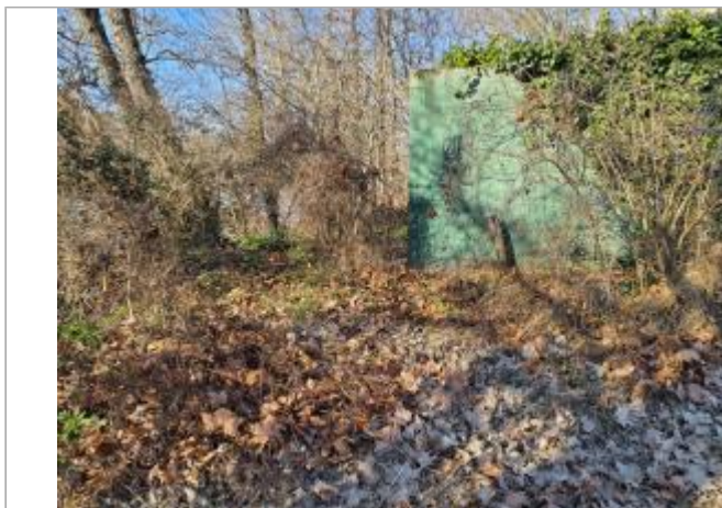
marque sur structure