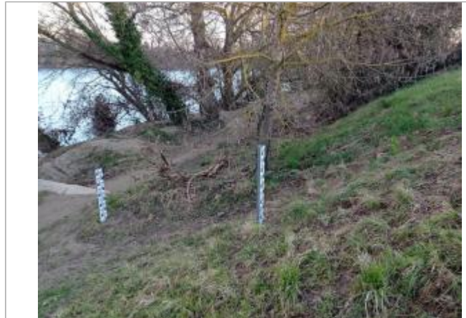
Débris végétaux

Coordonnées WGS84 : X: 1.40269840 / Y: 43.63764750