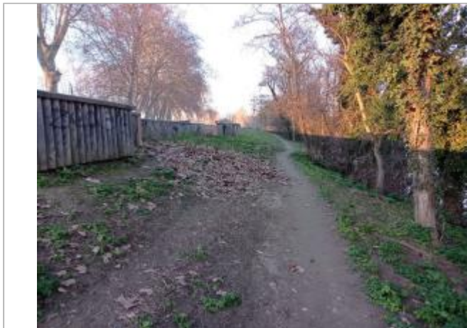
Débris de végétaux

Coordonnées WGS84 : X: 1.40256900 / Y: 43.63480370