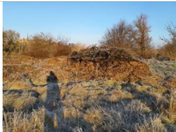
dépot sur Végétation