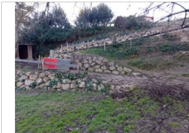
Débris végétaux

Coordonnées WGS84 : X: 1.40006890 / Y: 43.62787960