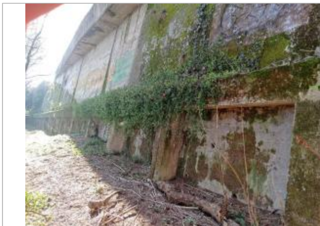
marque sur structure