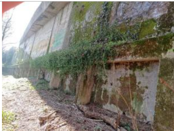
marque sur structure