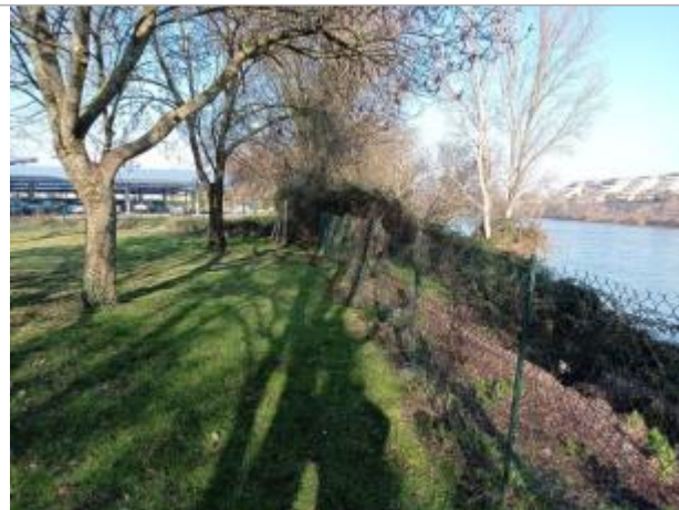
Débris de végétaux