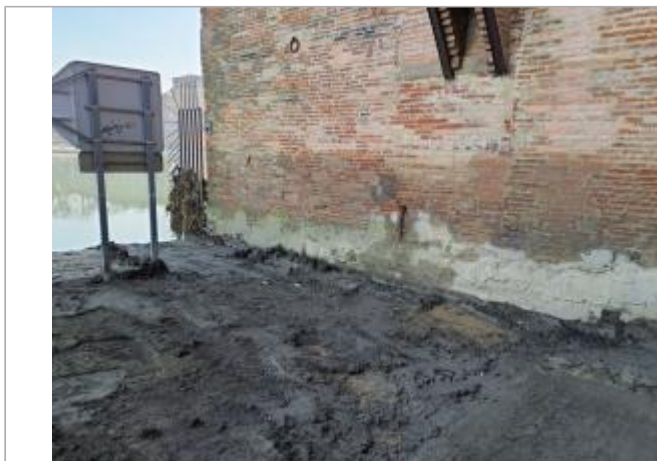
Marque sur structure