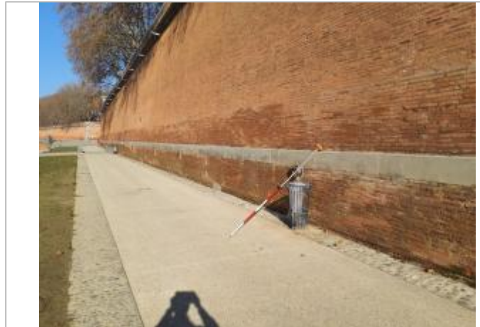
Marque sur structure

Coordonnées WGS84 : X: 1.43971200 / Y: 43.60031120