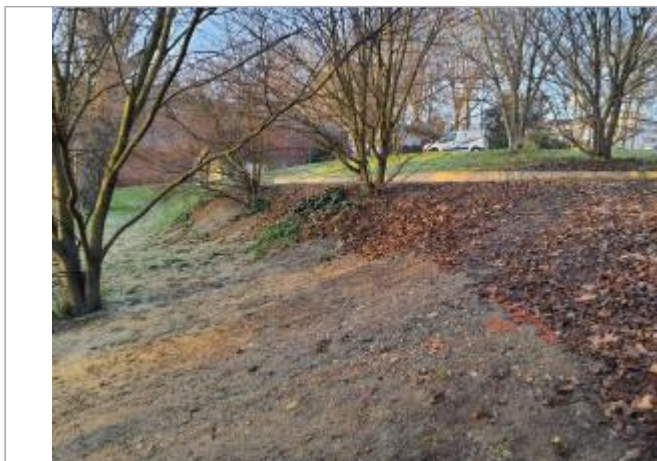
Marque sur feuillage