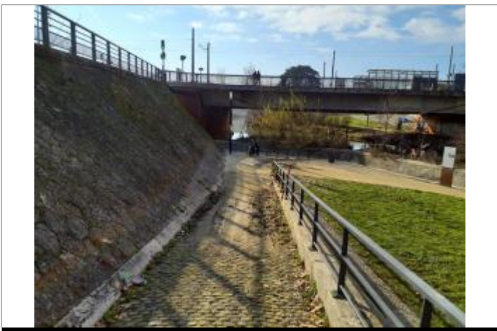
Marque sur digue

GÉOLOCALISATION Coordonnées WGS84 : X: 1.44071680 / Y: 43.59259930 Coordonnées RGF93 (Lambert 93) X: 574050.01 / Y: 6278303.91 Coordonnées RGF93 (ETRS89) : X: 1.4407168 / Y: 43.5925993 Code Hydro: O---0000 Rive de référence: Gauche