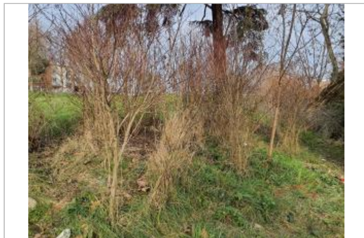
Sol Débris végétaux

GÉOLOCALISATION Coordonnées WGS84 : X: 1.44048410 / Y: 43.59122570 Coordonnées RGF93 (Lambert 93) X: 574028.2 / Y: 6278151.64 Coordonnées RGF93 (ETRS89) : X: 1.4404841 / Y: 43.5912257 Code Hydro: O---0000 Rive de référence: Gauche