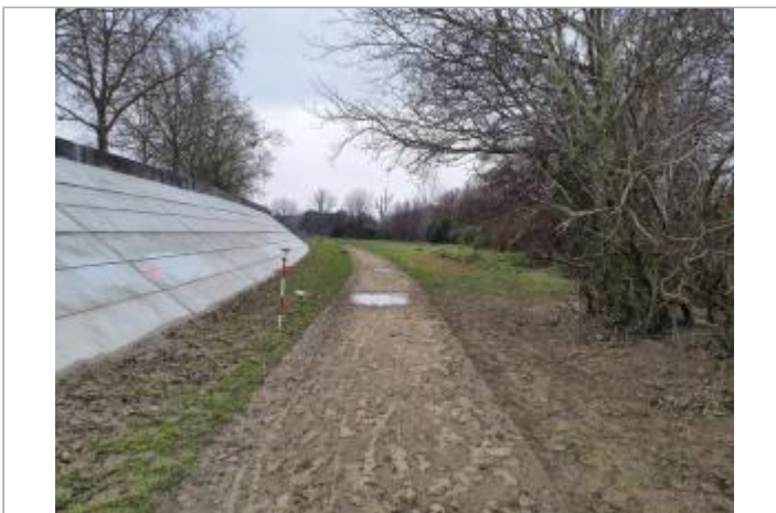
Marque sur digue en béton

GÉOLOCALISATION Coordonnées WGS84 : X: 1.43947820 / Y: 43.58833570 Coordonnées RGF93 (Lambert 93) X: 573940.61 / Y: 6277832.11 Coordonnées RGF93 (ETRS89) : X: 1.4394782 / Y: 43.5883357 Code Hydro: O---0000 Rive de référence: Droite