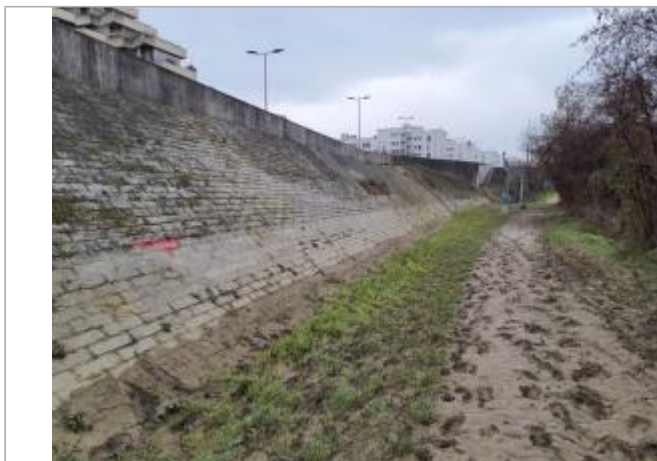
Marque sur digue