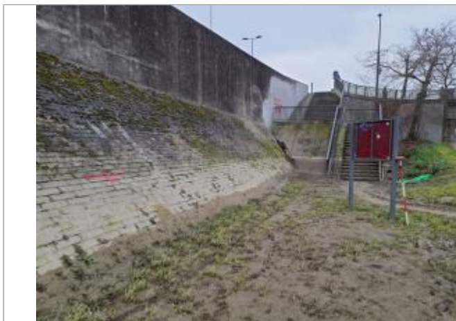
Marque sur digue