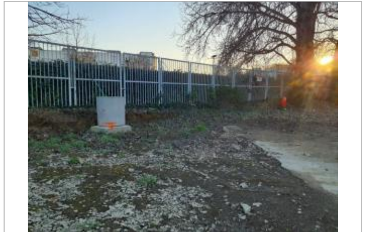
débris sur massif béton