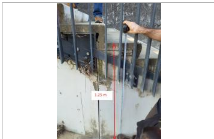
Vue du repère, mars 2026.