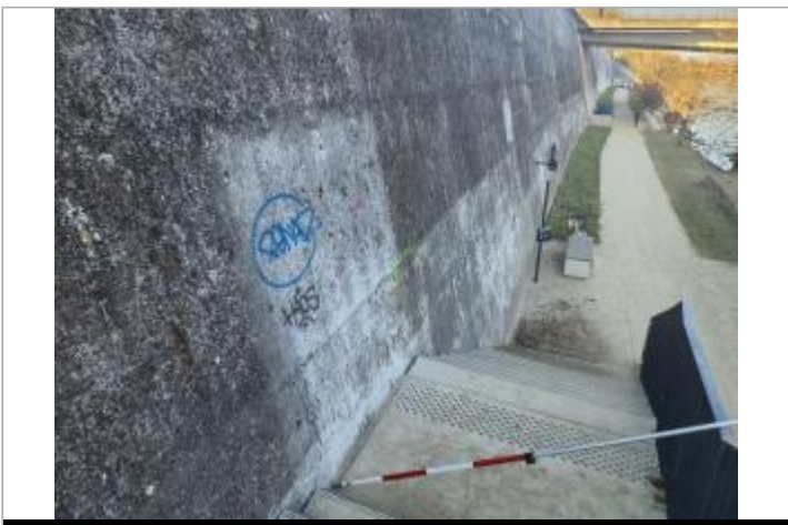
Marque sur structure proche À berge

GÉOLOCALISATION Coordonnées WGS84 : X: 1.42897300 / Y: 43.58431240 Coordonnées RGF93 (Lambert 93) X: 573083.21 / Y: 6277401.88 Coordonnées RGF93 (ETRS89) : X: 1.428973 / Y: 43.5843124 Code Hydro: O---0000 Rive de référence: Gauche