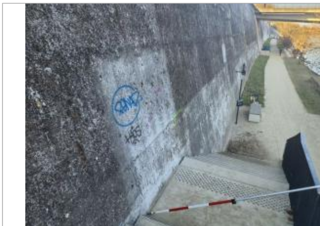
Marque sur structure proche À berge