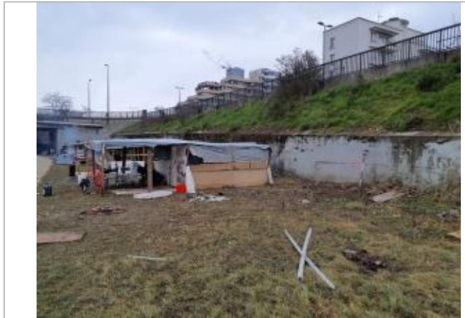
Marque sur structure

Coordonnées WGS84 : X: 1.43920000 / Y: 43.58345110