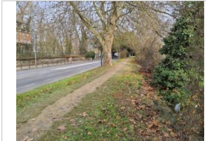
Sol debris vegetaux

Coordonnées WGS84 : X: 1.43529300 / Y: 43.57981990