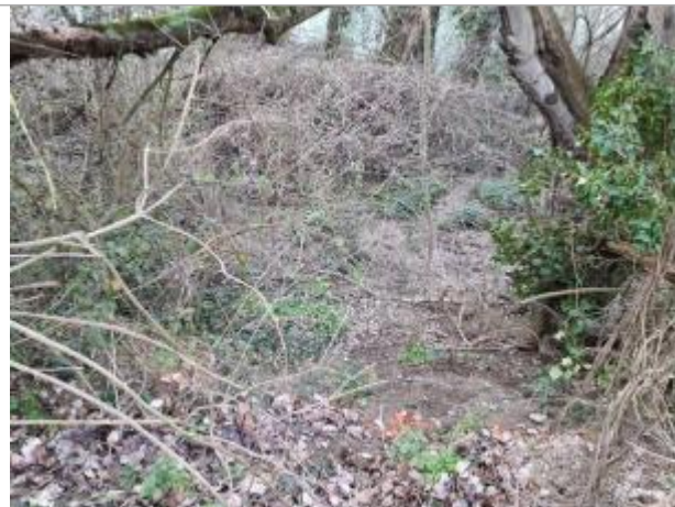
Sol debris vegetaux

Coordonnées WGS84 : X: 1.43074940 / Y: 43.57433750