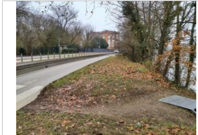
Sol debris vegetaux

Coordonnées WGS84 : X: 1.43466180 / Y: 43.57441520