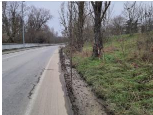
Sol debris vegetaux

Coordonnées WGS84 : X: 1.43642420 / Y: 43.57456740