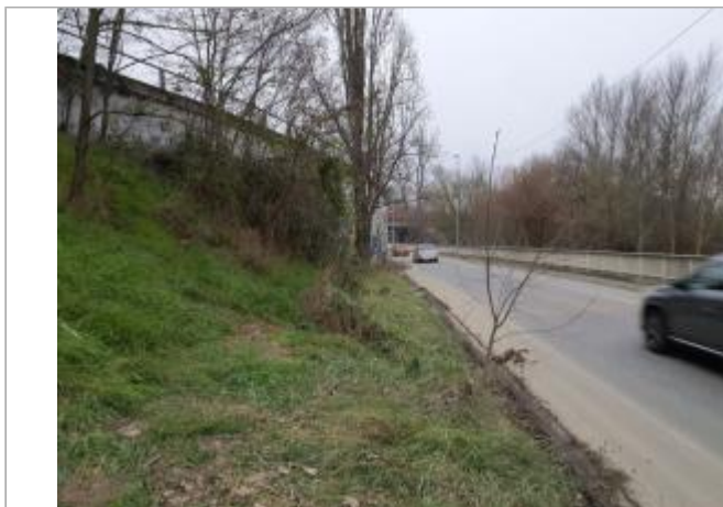
Sol debris vegetaux

Coordonnées WGS84 : X: 1.43674070 / Y: 43.57400720