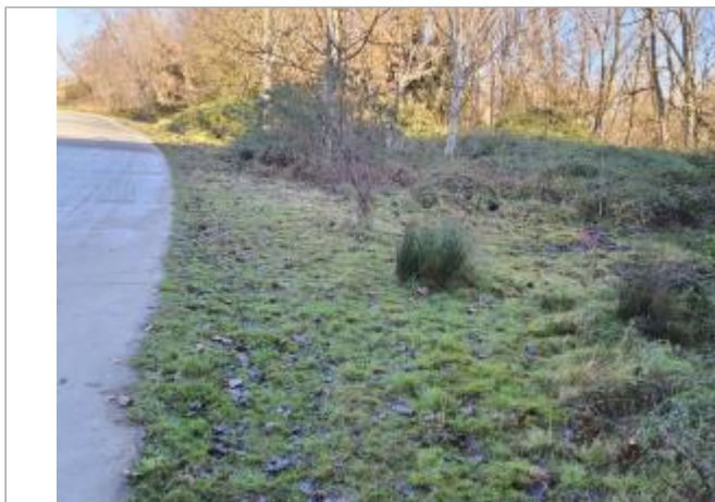
Débris végétaux au sol