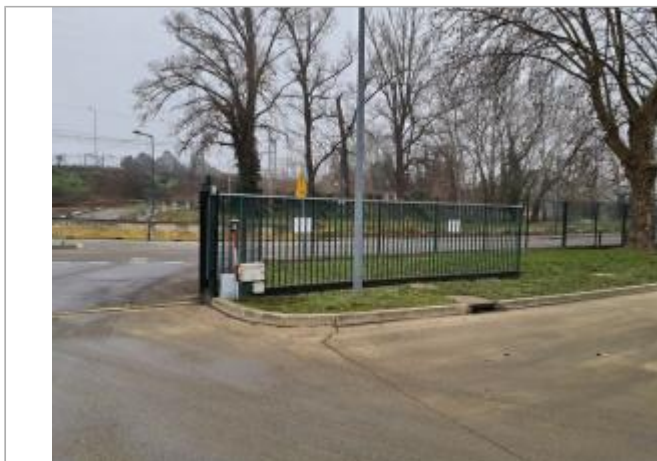
Marque sur équipement