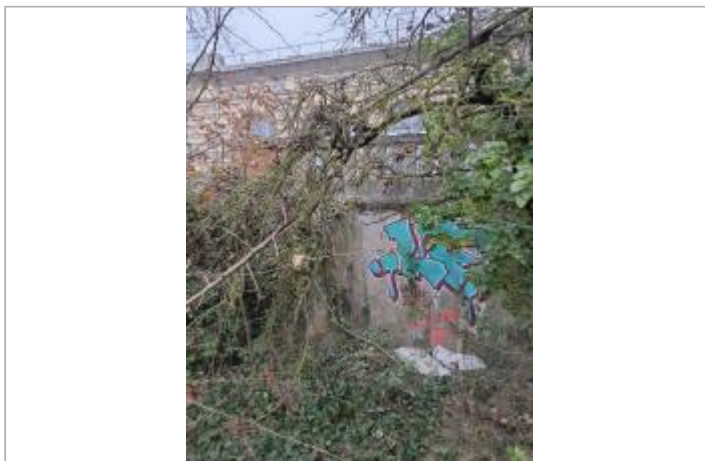
Marque sur bâtiment