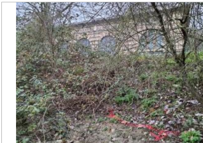
Sol debris vegetaux

Coordonnées WGS84 : X: 1.43929990 / Y: 43.56930030