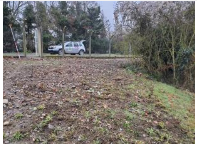
Sol debris vegetaux

Coordonnées WGS84 : X: 1.43265360 / Y: 43.56760720