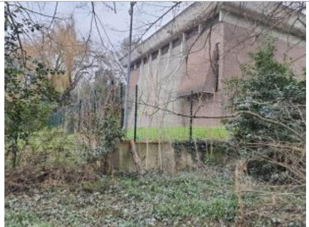
Marque sur mur

Coordonnées WGS84 : X: 1.43920630 / Y: 43.56660670