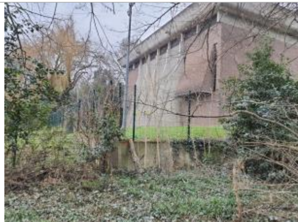
Marque sur mur