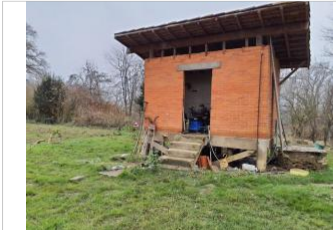
Marque sur bâtiment

Coordonnées WGS84 : X: 1.43909200 / Y: 43.56580840