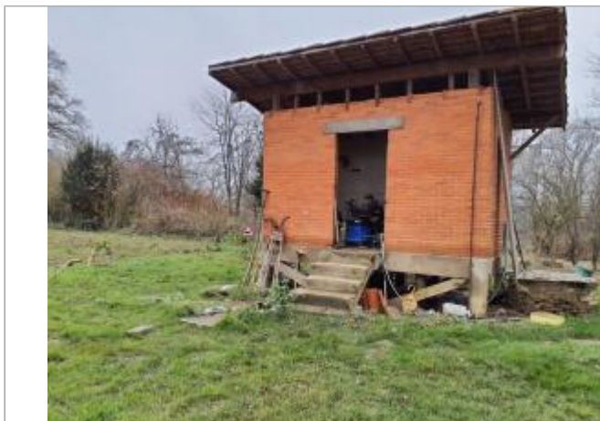
Marque sur bâtiment