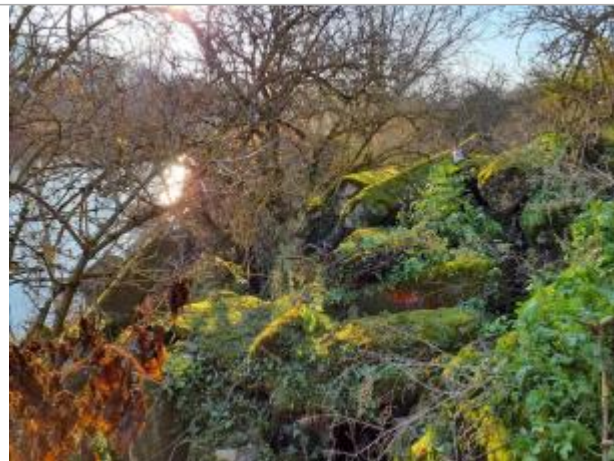
Marque sur sur les pierres