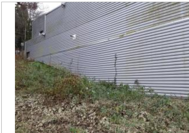
Marque sur bâtiment