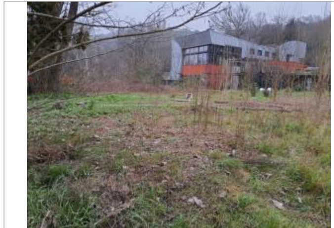
Sol debris vegetaux

Coordonnées WGS84 : X: 1.43873050 / Y: 43.56404650