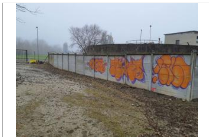
Marque sur mur

GÉOLOCALISATION Coordonnées WGS84 : X: 1.43708990 / Y: 43.56175490 Coordonnées RGF93 (Lambert 93) X: 573689.24 / Y: 6274882.26 Coordonnées RGF93 (ETRS89) : X: 1.4370899 / Y: 43.5617549 Code Hydro: O---0000 Rive de référence: Gauche