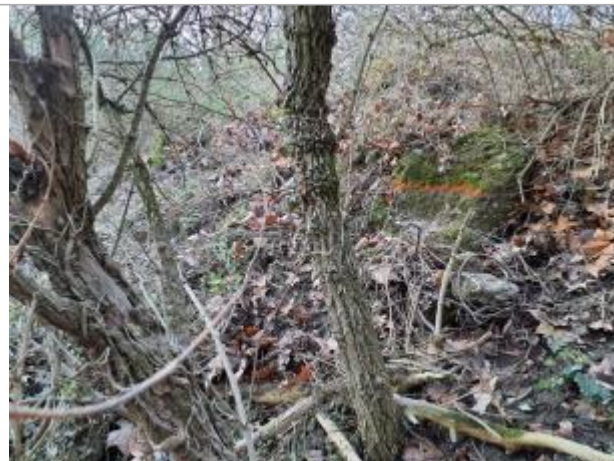
Marque sur sur les pierres