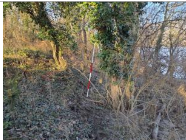
Trace sur végétation

Coordonnées WGS84 : X: 1.43773450 / Y: 43.55470940