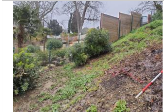
Sol debris vegetaux

Coordonnées WGS84 : X: 1.44003390 / Y: 43.55349860