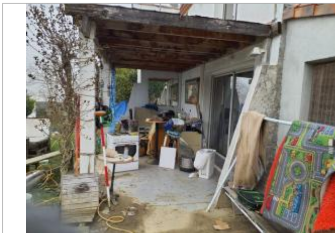
Marque sur meubles