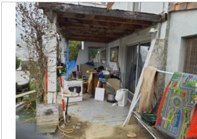
Marque sur meubles