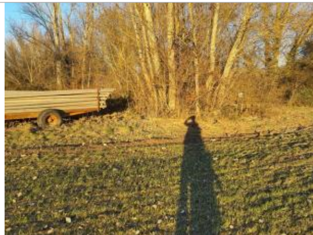
Marque sur voiture