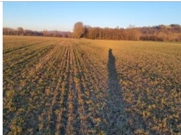
Sol debris vegetaux

Coordonnées WGS84 : X: 1.42306450 / Y: 43.53330480