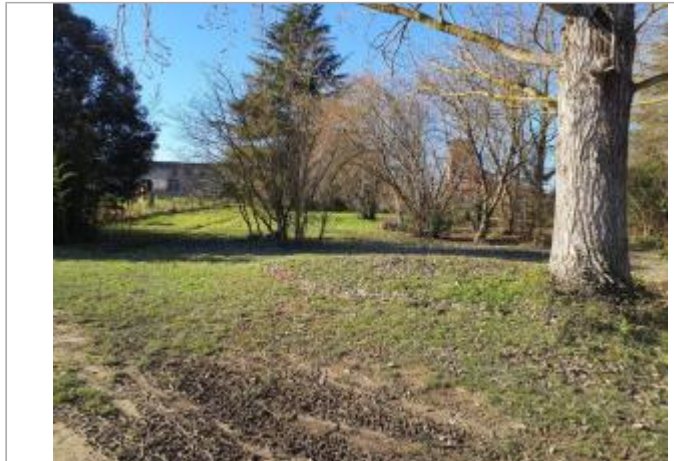
Sol debris vegetaux

Coordonnées WGS84 : X: 1.41702680 / Y: 43.52914040