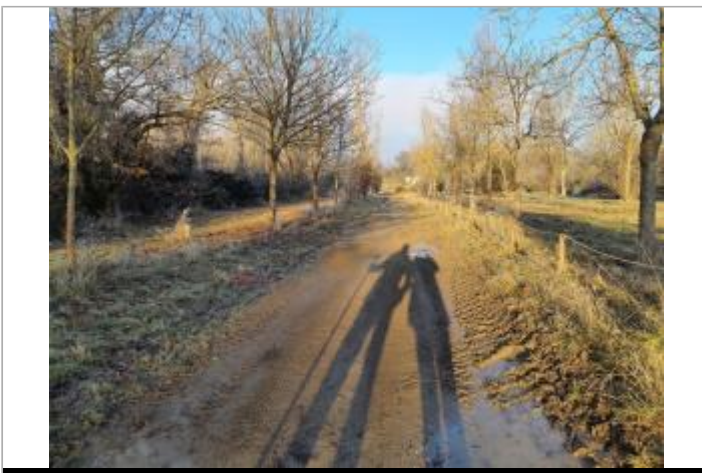
Debris vegetaux au sol sur le Chemin du Port

GÉOLOCALISATION Coordonnées WGS84 : X: 1.41790340 / Y: 43.52455210 Coordonnées RGF93 (Lambert 93) X: 572055.99 / Y: 6270779.08 Coordonnées RGF93 (ETRS89) : X: 1.4179034 / Y: 43.5245521 Code Hydro: O--0000 Rive de référence: Droite