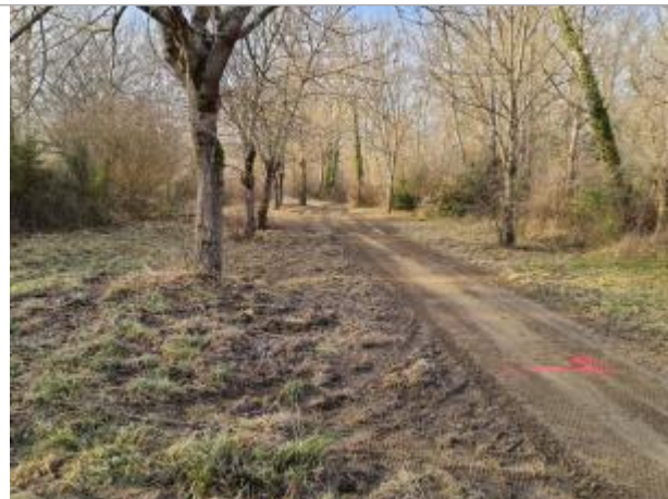
Marque sur chemin en terre proche au Chemin du Port